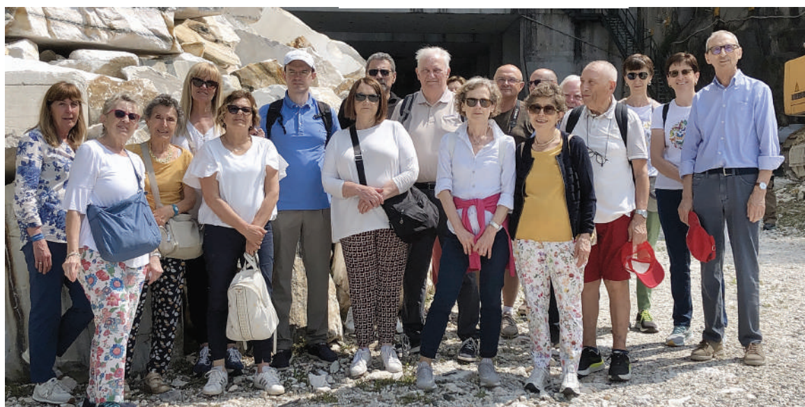
All'ingresso della cava. Il gruppo dei Soci che ha visitato i luoghi di estrazione e lavorazione del marmo a Candoglia.