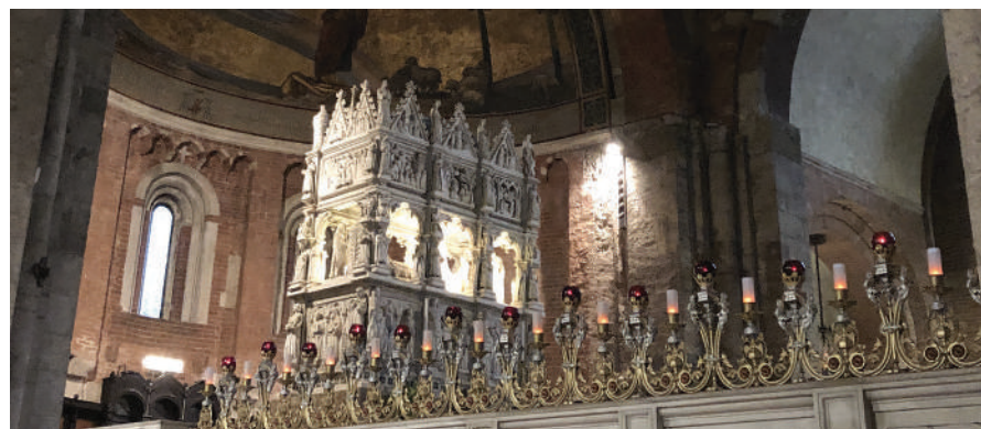
L'Arca. Sopra, interno della Basilica di San Pietro in Ciel d'Oro con l'Arca del 1362 dove sono custodite le reliquie di Sant'Agostino. A destra le torri medievali.

P avia ha aperto il ciclo delle visite guidate per Soci e clienti. Un buon inizio, quello di sabato 15 marzo, con un gruppo di 35 partecipanti. Numerosi i motivi per conoscere la città, ma per chi vive in Brianza due acquistano un particolare valore. Innanzitutto le radici longobarde: qui la regina Teodolinda aveva il suo quartier generale e d'estate si trasferiva a Monza dove in Duomo si trovano oggetti d'arte preziosi a partire dalla Corona ferrea. Nella Basilica di San Pietro in Ciel d'Oro, invece, una imponente arca, gioiello di scultura del XIV secolo in marmo di Candoglia, custodisce le reliquie di Sant'Agostino che in Brianza, a Cassago, ha soggiornato maturando la sua conversione. «Questi legami con il nostro territorio – afferma Giampietro