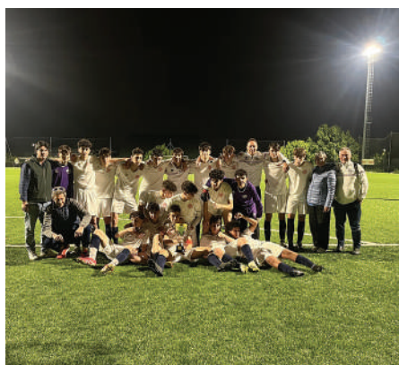
Triuggese 2009, 1a classificata