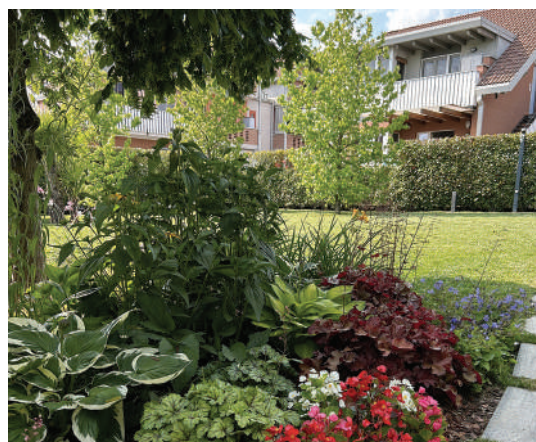
Il parco automezzi. La dotazione di mezzi schierati sul piazzale all'ingresso dell'azienda di Sovico. Visibili sul tetto del capannone gli impianti fotovoltaici. A destra un giardino realizzato in una villa del milanese.