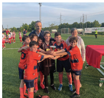
San Giorgio Desio 2014