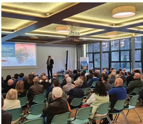
Finanza comportamentale. Clienti presenti in Villa Biffi all'incontro sulla gestione degli investimenti in tempi complessi.

I l valore del tempo nella finanza, ovvero quando e come investire in momenti di volatilità per gli scenari internazionali. Il delicato tema è stato affrontato da circa 100 clienti BCC Valle del Lambro presso il centro di Villa Biffi con consulenti ed esperti di Fidelity International, società che fornisce servizi di gestione degli investimenti. L'incontro promosso dalla Banca si è avvalso della collaborazione della Capogruppo. I partecipanti sono stati aiutati a capire e a saper gestire i meccanismi che presiedono e condizionano le scelte personali in campo finanziario, meccanismi che vengono definiti "bias cognitivi". I più comuni sono: il bias dell'avversione alle perdite che porta a dare più peso alle perdite che ai guadagni, anche quando i numeri suggerirebbero il contrario; il bias della disponibilità che fa prendere decisioni basandosi su informazioni recenti e spesso non rilevanti. Poi c'è il bias dell'eccesso di fiducia che agisce con la convinzione di possedere maggiori capacità di previsione rispetto alla realtà.