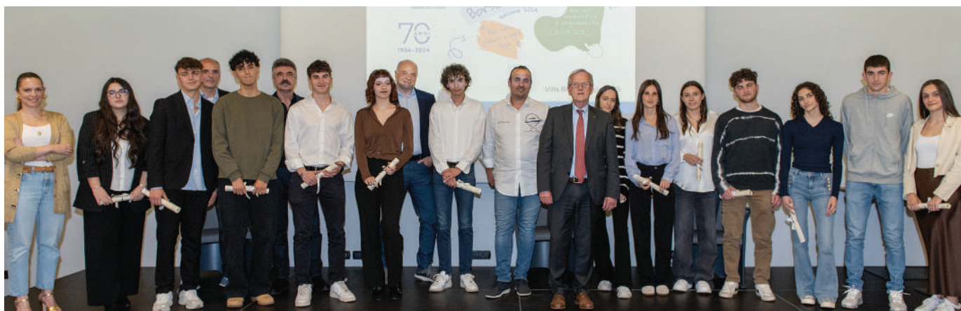
Diplomati Superiori. Il gruppo dei venti giovani diplomati alla maturità che hanno vinto un assegno di studio e sono stati premiati in Villa Biffi la sera di venerdì 16 maggio.