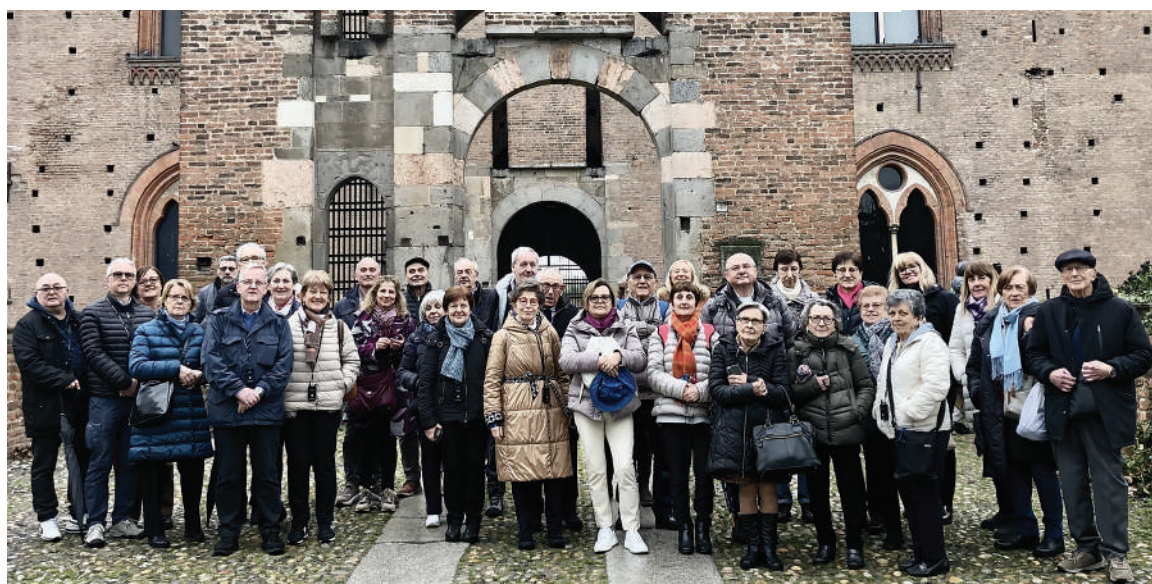
I partecipanti. Il folto gruppo di Soci e partecipanti all'ingresso del Castello Visconteo costruito nel 1360 su ordine di Galeazzo II Visconti, che vi trasferì la sua corte.