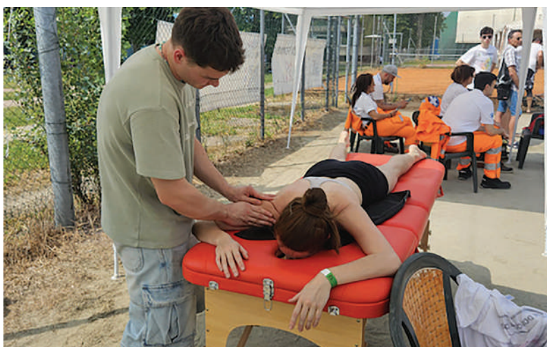
Fisioterapia. Per tutta la durata del Torneo sono stati presenti un giovane fisioterapista e un servizio ambulanza. La manifestazione è stata ripresa anche da un drone.