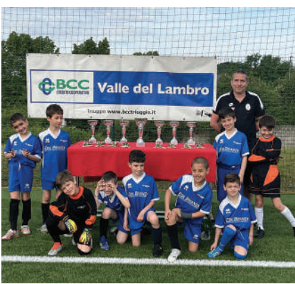
Stella Azzurra 2017