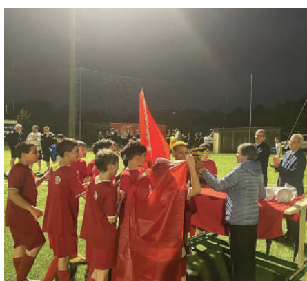
Triuggese 2013, 1a classificata