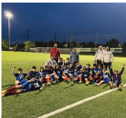
Triuggese 2011, 1a classificata