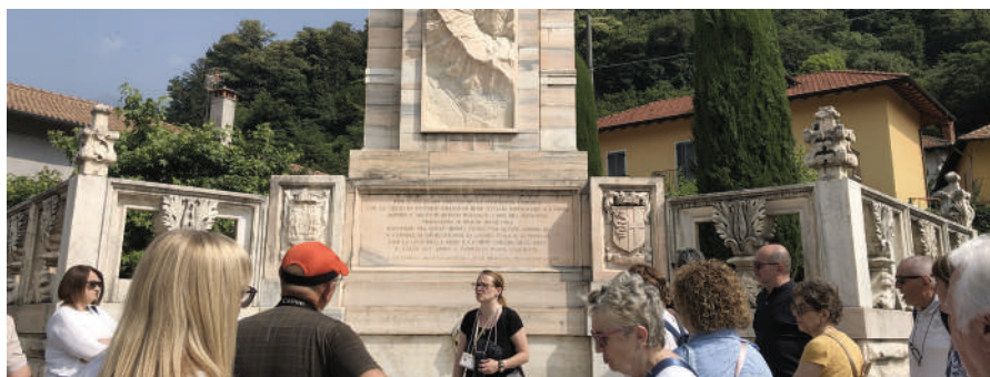
Il monumento. La guida illustra al gruppo la storia di Candoglia davanti al monumento eretto per ricordare il Duomo di Milano. A sinistra l'ingresso alla cava.

Candoglia, la piccola frazione del comune di Mergozzo all'imboccatura della Val d'Ossola, in Piemonte, è sinonimo di Duomo di Milano. I marmi dalle delicate sfumature, le guglie e le oltre 3.500 statue che rendono inconfondibile in tutto il mondo il simbolo milanese, arrivano dalle cave di Candoglia. Nel Trecento, quando inizia la costruzione della cattedrale, i pesanti blocchi estratti dalla montagna vengono fatti scivolare a valle fino a raggiungere le rive del fiume Toce dove apposite chiatte li imbarcano per intraprendere la navigazione prima lungo il Toce, poi sulle acque del lago Maggiore fino a imboccare i navigli diretti a Milano e raggiungere il porticciolo del "Laghetto" a pochi passi dal Duomo. Una storia