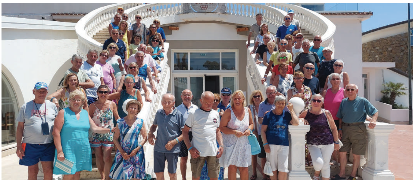
Cilento. Il gruppo dei Soci che ha trascorso la vacanza al Club Olimpia, resort sul mare a poca distanza dalla zona archeologica di Velia nel Parco nazionale del Cilento.