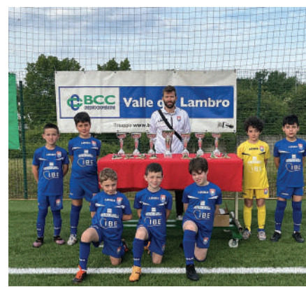
Academy Merate 2017