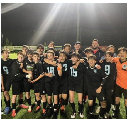
Lesmo 2012, 1a classificata