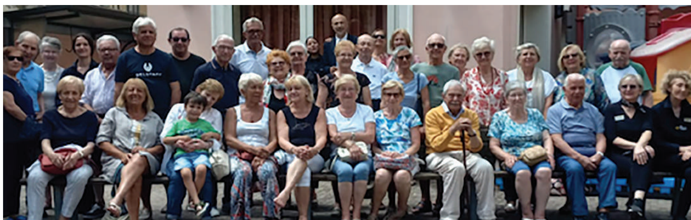
Alassio. Meta classica e sempre apprezzata dai Soci e clienti della Banca. Anche quest'anno il gruppo che ha soggiornato a fine maggio all'Hotel Toscana è stato numeroso.

che hanno scelto di trascorrere la settimana dall'1 all'8 giugno al Club Olimpia Cilento Resort, a poca distanza dalla zona archeologica di Velia nel Parco nazionale del Cilento, direttamente sul mare. Velia è famosa per essere la patria di una antica e importante scuola di filosofia, quella di Parmenide e Zenone. Il sito archeologico narra ancora oggi la storia di una grande città della Magna Grecia la cui fondazione risale circa al 540 a.C. ad opera di abitanti di Focea che lasciarono la Turchia per sfuggire all'assedio dei Persiani.