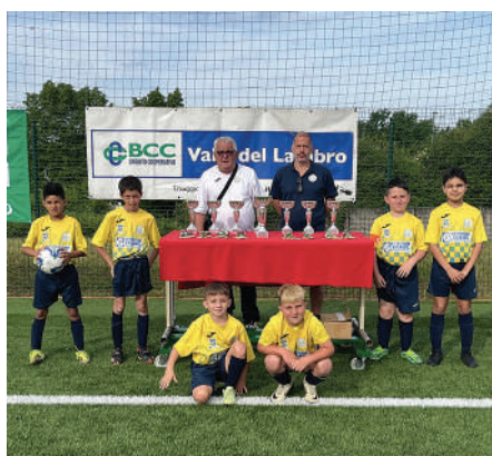
CGB Brugherio 2017